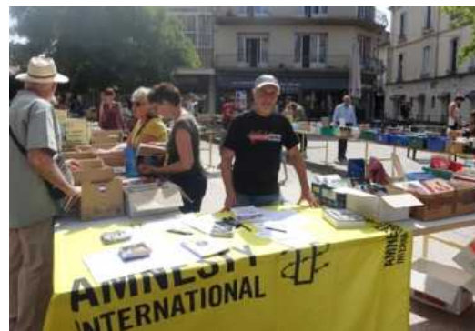
Tous les ans, l'association propose une foire aux livres place Wilson. A. GR.

RENTÉE SCOLAIRE Pour inscrire votre ou vos enfants dans une école agenaïse à partir de septembre prochain (pour les nouveaux arrivants, les enfants qui atteignent l'âge de 3 ans...) il faut vous munir du livret